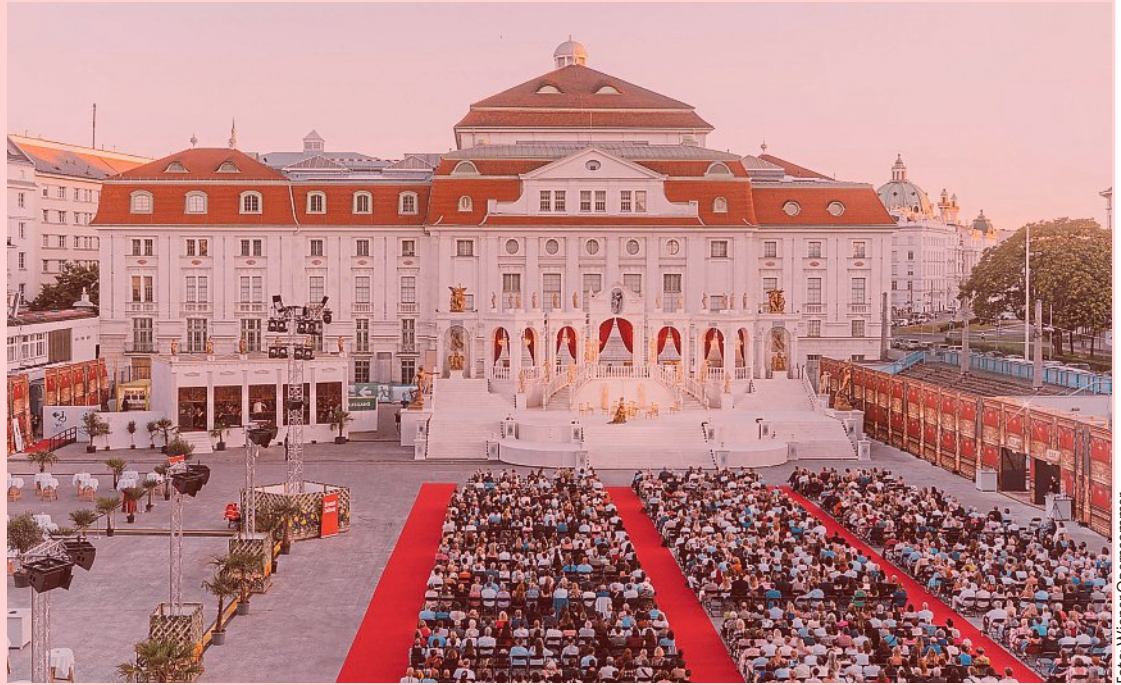
Einzigartig in Wien: das „Opern Open Air“ vor dem Konzerthaus am Wiener Heumarkt mit hochkarätiger Besetzung, dem Wiener Kammerorchester und Philharmonia Chor Wien.

„Carmen‘ ist eine meiner Lieblingsoper, die ich bereits mehrmals ausstatten durfte. Ihre Musik ist einzigartig – und für einen Bühnenbildner bleibt jede Inszenierung dieser Oper eine besonders erfüllende Herausforderung.“ Einen ersten Eindruck davon, was die Besucher erwartet, gibt Waba bereits jetzt: Durch aufwendige Umbauten und großflächige Projektionen entstehen unterschiedliche Schauplätze – vom belebten Platz vor der Tabakfabrik mit detailreichem Nachbau des Brunnens auf einer Dreh-